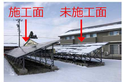
富山県砺波市S発電所

取り込まれた水分が常に蒸発するため気化熱で温度上昇を抑えます。 （各メーカーは必ず夏期の温度上昇による発電ロスは明記しています）